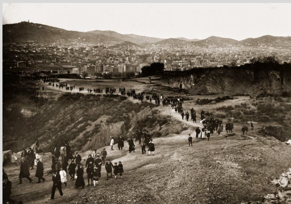
Pujant a Montjuïc, fa uns 100 anys

Caminada circular per paratges i racons inhabituals; anirem a parar a vuit punts de diferents parts del parc, on gaudirem dels seus valors paisatgístics i patrimonials.