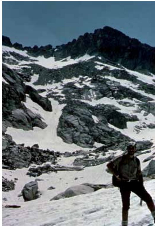
Comoloformo 3.033 m