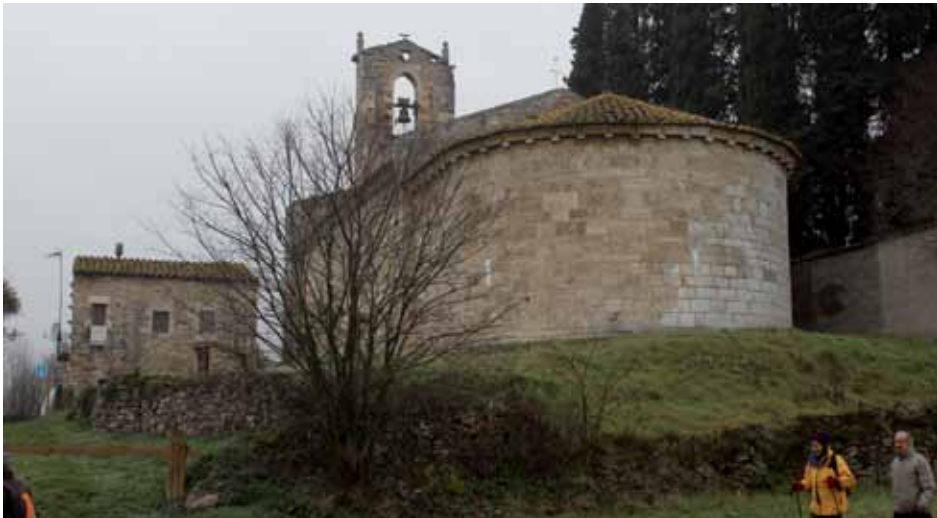
Santa Maria de Porqueres

Aquí es pot visitar l'església romànica de Santa Maria de Porqueres (s. XII) i el comunidor (s. XVII-XVIII) des d'on es demanava protecció contra les tempestes i es foragitaven els mals esperits. L'ocupació humana del turó és molt antiga i s'hi troben restes des de l'època dels ibers.