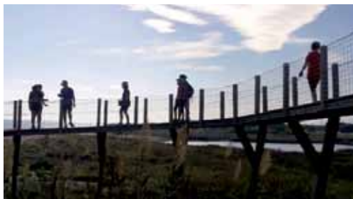
El semàfor del Prat

Cada 5 min. ens passaven per sobre els avions que aterren a l'aeroport i entremig vam gaudir d'una fauna protegida sobretot d'ocells. Recorregut ideal per ornitòlegs i apassionats de l'aeronàutica.