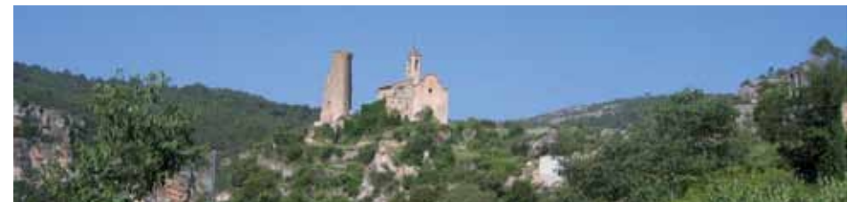
Sta Perpètua de Gaià

Arribem aviat a una trifurcació al final d'una pujadeta. Prenem el tren-call del mig, per tot seguit agafar-ne un altre que per l'esquerra mena al mas de Cal Corralet. Pel darrera del casalot de Cal Corralet es creua una feixa i amunt fins a la pista de mas Baldric. Continuarem a la dreta