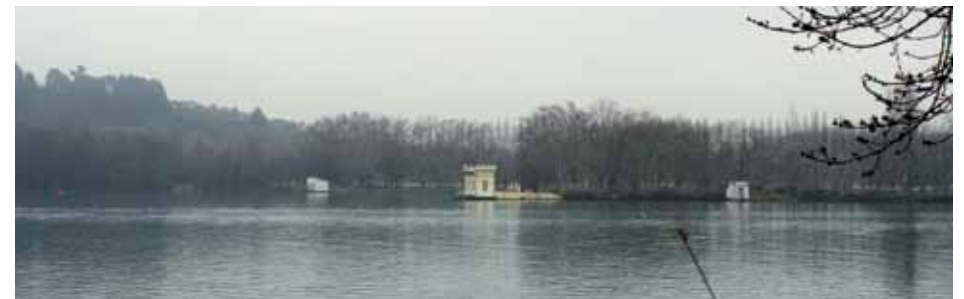
Vista del llac

Un projecte Life-Natura de la UE va permetre, entre 2005 i 2007, construir diverses llacunes al pla de Can Morgat. Són bons exemples de recuperació de zones humides, que antigament eren dessecades per incrementar la superfície agrícola i actualment permeten millorar el paisatge i augmentar la biodiversitat de l'entorn de l'estany. A la llacuna d'en Margarit es pot observar la fauna aquàtica des d'un aguait. A continuació, en direcció al puig Clarà, passeu pel costat mateix de la llacuna de l'Aulina. A partir d'aquí el camí comença a enfilarse cap als turons.