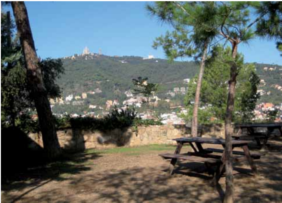
Àrea de picnic al cim

És un espai verd de marcada inclinació i vegetació esponerosa. Nombrosos camins pavimentats amb macadam faciliten el passeig, travessant una orografia accidentada i que menen suaument cap al cim; hi ha més rampes que escales i nombroses placetes d'estar al final de