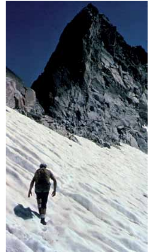
Bretxa Besiberri Sud

Des de la bretxa, escalem un diedre de III per crestes fins l'avantcim, i després sense cap dificultat arribem al Besiberri Central (3003m).