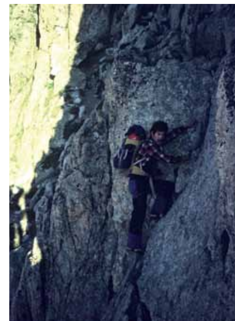
Pujant Besiberris Nord