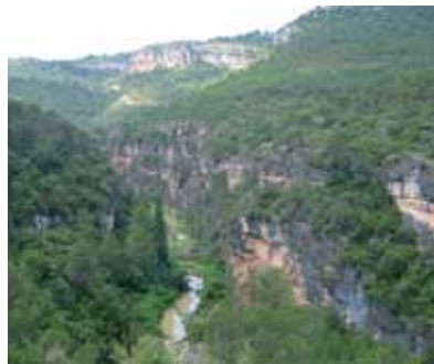
Gorgs d'el Gaià

El camí de Vallespinosa per la serra Morena surt del collet de la bassa. Cal refer un curt tros del camí de la plana Guixera fins a la part superior d'uns camps. Prendrem la direcció nord, creuarem unes feixes de conreu i vers la clotada del Magí. Aquí entronquem amb el Sender GR-7 que ens menarà a Vallespinosa. Cal visitar la font del poble enmig d'un tou d'alzines.