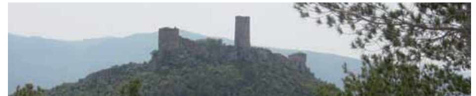
Castell de Saburella

A continuació per replans enlairats passarem pel castell de Saburella, i amunt a la serra de Selmella. Des de les restes del seu castell, una vista fins la Mediterrània. El lloc de Vallespinosa, paratge amagat de serenor intensa.