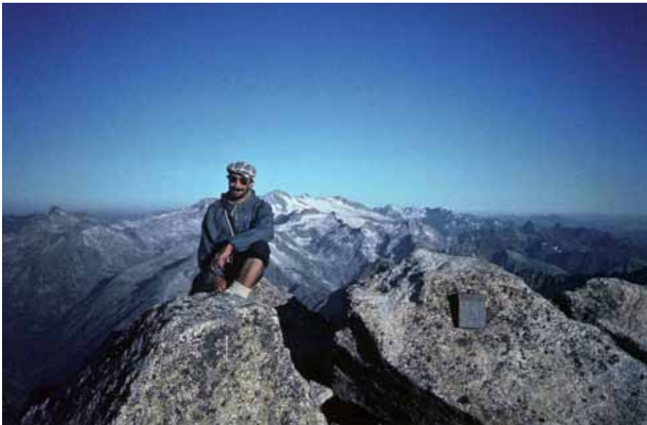
Dalt de Besiberri Nord 3.014 m

Ens hi estem una bona estona per esmorzar, i després amb precaució baixem fins a la bretxa Jaume Oliveres (I i II) amb roca força descomposta, cosa que anirem trobant en tot el recorregut.