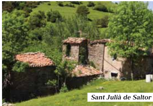
Sant Julià de Saltor

En 40 minuts arribem al Collet del Vent (1.388). El temps és magnífic i una mica de vent ens alleuja del que podria ser un dia molt calorós. 25 minuts més tard i estem a Sant Julià de Saltor (1.375m).