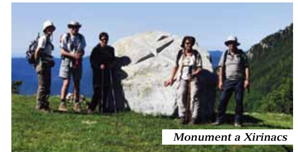
Monument a Xirinacs

Desnivell acumulat: 595m Llargada: 8,55km Temps aproximat: 3:30h Temps total: 4:30h Assistents: 5