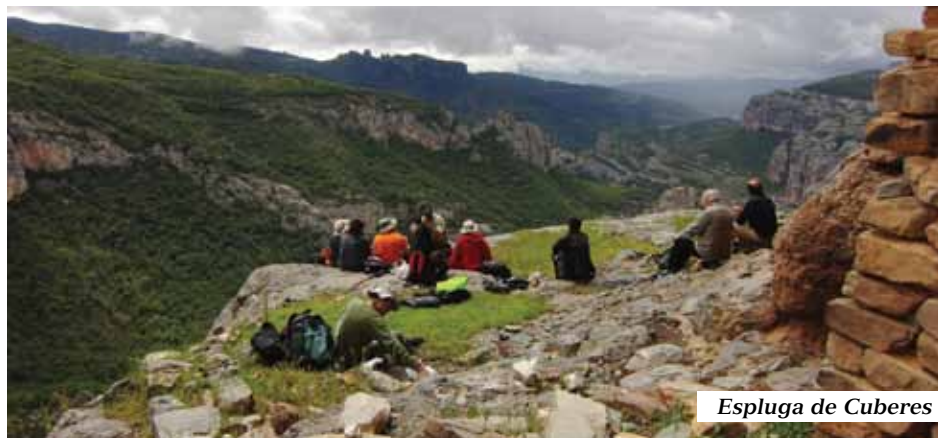
Espluga de Cuberes

Al cap de poc més d'una hora passem el trencall (1.100m) que, de tornada, ens portarà al poble de L'Espluga de Cuberes.