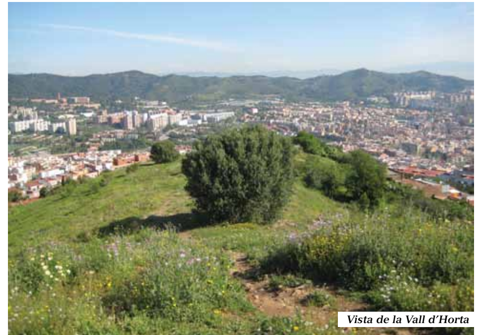
Vista de la Vall d'Horta

urbanització del pendent d'Horta, es començaren a edificar les primeres casetes i torres per part de la població que deixà l'estretor barcelonina, configurant el que després seria El Carmel: un barri construït a la muntanya. Va créixer la barriada amb la construcció anàrquica de les dècades de 1950 i 1960, autoconstruccions fetes per famílies immigrants del sud peninsular. Posteriorment s'agregaren habitatges plurifamiliars en llocs inversemblants sense establir se serveis ni carrers. Els qui empenqueren les infraestructures i equipaments que li mancaven i a dignificar el possible, van ser els primers consistoris democràtics. Els treballs van anar progressant lentament des d'aleshores, rematats amb la instal·lació d'ascensors i escales mecàniques el 2010!