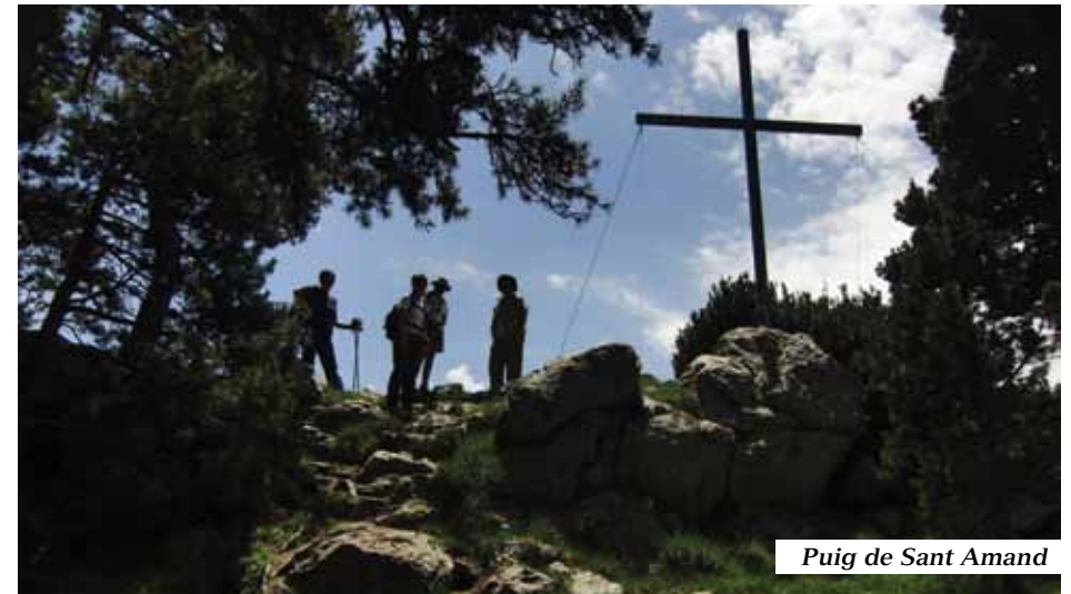
Puig de Sant Amand

pujada per una dreta i pedregosa canal, arribem a la font del Pi o de Pena (1.720m). Aquesta font d'aigua molt freda, els mapes la situen molt més amunt, un cop passat el Puig de Sant Amand. Reposem una mica, refem les nostres cantimplors i seguim pujant per arribar al cim al cap de 15 minuts. Realment l'alçada màxima de 1.851 s'assoleix a dos minuts de la creu, en direcció oest, en arribar a la carena.