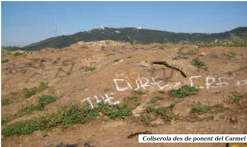
Collserola des de ponent del Carmel

La muntanya del Carmel prengué aquest nom a partir de 1864 arran de la inauguració de l'ermita de la Mare de Déu de Mont Carmel al vessant meridional; ben aviat es popularitzà com a lloc d'aplecs, fontades i celebracions religioses per part de gent de les veïnes Horta i Gràcia, deixant enrere el topònim original de Turó d'en Mora que era de la masia situada en aquest indret. Justament Can Mora (Coll del Portell), és l'únic mas que es conserva, transformat en geriàtric, dels diversos que n'hi havia: Can Xirot (La Salut), Can Muntaner de Dalt i Can Coll i Pujol (parc Güell) i Can Grau (Horta), foren els principals terrenys que serviren en part o totalment per a bastir els parcs del Carmel i Güell. La senzilla ermita fou restaurada el 1998 i en el cantó del carrer Santuari es construí el modern i desangelat temple obert el 1988. Culmina junt amb el Turó de la Rovira la petita alineació muntanyosa comunament anomenada Muntanya Pelada, té una alçària de 267m.