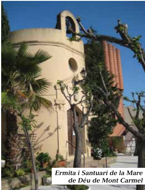
Ermita i Santuari de la Mare de Déu de Mont Carmel

trobarem un mirador i el monument escultòric format per grans peces planes de gres de Montjuïc simulant làpides d'una necròpolis, amb la inscripció L'ORDRE D'AVUI ÉS EL DESORDRE DE DEMÀ, una frase de Louis SAINT JUST, borgonyó del segle XVIII, polític revolucionari francès guillotinat als 26 anys per correligionaris seus, que l'escultor escocès Ian Hamilton Finlay va prendre fent referència a l'«harmonia –batibull» de les àmplies vistes de Barcelona que es perceben des d'aquest punt.