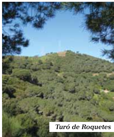
Turó de Roquetes

Aquest és l'últim capítol pel que fa als SET TURONS (I MIG) DE BARCELONA. Es tracta del turó de Roquetes, el més septentrional de la ciutat, una estribació de la serra de Collserola ressaltada pel Portell de Valldaura, en el districte de Nou Barris. Fa de carener dels barris de Roquetes i Torre Baró, és el més baixet (304 m.) dels tres de la contrada i té tots els vessants en el municipi barceloní. Els altres, són el Turó d'en Segarra (326 m.) i el Turó Blau (310 m.), separats d'aquell pel petit coll de Canyelles i ambdues cares nord pertanyents a Moncada i Reixac.