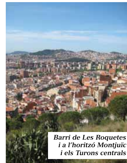
Barri de Les Roquetes i a l'horitzó Montjuïc i els Turons centrals

Els boscos de la cara nord mantenen la vegetació característica de Collserola i ens proporcionen una magnífica visió sobre Barcelona, els Vallesos i la vall del Besòs. Disposen de camins de passejada, que menen a La Trinitat Nova, Vallbona, Serra de la Ventosa, Forat del Vent o Valldaura. Si es vol fer una excursió plaent, prenem el ben senyalitzat PR-C 171 fins a Molins de Rei, amb possibles itineraris intermedis. Per senders no tan fressats ni indicats podrem anar a Cerdanyola o Sant Cugat, tot guimbant carenades. També els travessa la Ronda Verda de BTT, un circuit de 72 km. carril bici que envolta el Barcelonès.