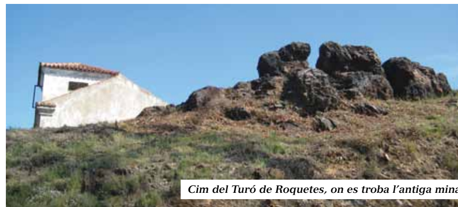
Cim del Turó de Roquetes, on es troba l'antiga mina

Es tracta del popularment anomenat CASTELL, pel seu aspecte medieval; en realitat l'estructura d'un hotel inacabat, que havia de ser el nucli d'una ciutat jardí en uns paratges d'una qualitat natural excepcional. Promoguda per la Compañía de Urbanización de las Alturas del Nordeste de Horta fundada el 1904, per Manuel de Sivatte destacat barceloní propietari d'aquestes muntanyes, i aviat en fallida. Es creu que el topònim prové de l'antiga torre del Baró de Pinós, un palau del segle XVI situat a la mateixa falda prop del Besòs, enderrocat el 1967.