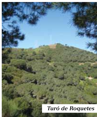
Turó de Roquetes

Aquest és l'últim capítol pel que fa als SET TURONS (I MIG) DE BARCELONA. Es tracta del turó de Roquetes, el més septentrional de la ciutat, una estribació de la serra de Collserola ressaltada pel Portell de Valldaura, en el districte de Nou Barris. Fa de carener dels barris de Roquetes i Torre Baró, és el més baixet (304 m.) dels tres de la contrada i té tots els vessants en el municipi barceloní. Els altres, són el Turó d'en Segarra (326 m.) i el Turó Blau (310 m.), separats d'aquell pel petit coll de Canyelles i ambdues cares nord pertanyents a Moncada i Reixac.