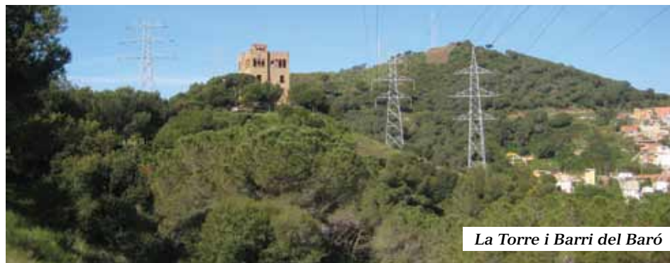
La Torre i Barri del Baró

Tota la superfície és parc forestal, ara i adés els espais es van posant en valor patrimonial per a la ciutadania, encara lentament. Caldrà adequar els edificis, les tres fileres de torres d'alta tensió, les antenes i els boscos del costat marítim malmesos pel foc. La carretera Alta de Roquetes ens apropa a la serralada, on prop del final trobarem el MIRADOR al peu de l'edifici de LA TORRE DEL BARÓ que amb sorprenent perfil domina el districte i n'és el seu més preuat monument, oferint unes esplèndides vistes de la Barcelona més nova i desconeguda.