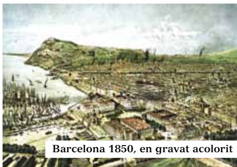
Barcelona 1850, en gravat acolorit