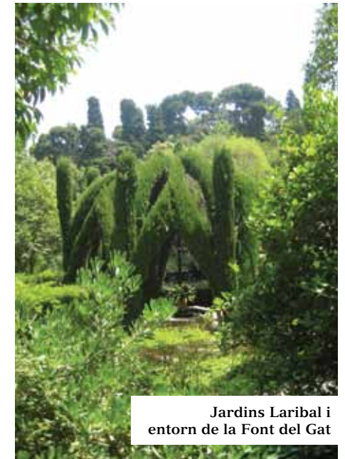
Jardins Laribal i entorn de la Font del Gat