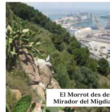
El Morrot des del Mirador del Migdia

3) MIRADOR del MIGDIA.- Pujarem per les escalinates fins l'avinguda de l'Estadi, davant del Jardí d'Aclimatació vora la Campana de la Llibertat i amunt, en direcció sud-oest sobrepasant el Nou Jardí Botànic. Tombarem pel carrer de Can Valero i prendrem el passeig del Migdia o trencant dret per la pineda cap el cim. En el carener, a tocar la part alta del cementiri, localitzarem el MIRADOR del MIGDIA des d'on s'albira el Port Nou, la Marina de l'Hospitalet i bona part del Baix Llobregat. Seguirem pel CAMÍ del MAR, un camí de ronda a sota de la muralla i per sobre el penya-segat del MORROT (de morro), en aquest vessant hi ha l'evocador FAR bastit el 1925. Amb una mica de sort podrem observar falcons o xoriguers, doncs aquí tenen el seu principal hàbitat protegit.