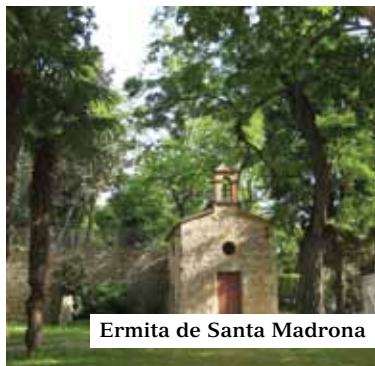
Ermita de Santa Madrona

1) ERMITA de SANTA MADRONA.- Al lateral esquerre de l'edifici, vist des de la Fira, la veurem dins d'un tancat en el fons d'una esplanada arbrada, és l'única ERMITA de les set que van existir a la muntanya. Neoclàssica del 1754 sobre l'original gòtica, ha sobreviscut perquè la va comprar i restaurar un particular l'any 1907. Està dedicada a SANTA MADRONA, cronològicament la segona de les tres patrones de la ciutat, una màrtir d'origen grec del segle III, avui força ignorada. Continuarem, tot rodejant la façana posterior del Palau Nacional.