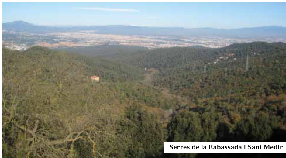
Serres de la Rabassada i Sant Medir

Bonica sortida cap al Tibidabo que recorrerem pels entorns, sense entrar al recinte ni passar per les instal·lacions i edificis del cim. Itinerari que dóna moltes possibilitats per ampliar-ho. El recorrerem pel perímetre, sent el Coll de la Vinassa (468 m.) el punt més distant, a vegades nomenat erròniament Vinyassa. Agradable pujada per pistes forestals de solell i un lleuger desplaçament a l'obaga per camins de carena fins a arribar al Coll pel vessant vallesà, entre frondosos boscos de pins a partir del passeig de les Aigües i passant per alzinars amb roures de la Font de la Salamandra. Baixada mixta per corriols i camins de ponent. Gaudirem d'oberts panorames sobre Barcelona i el litoral, així com de les serres i muntanyes emblemàtiques que encerclen Collserola.