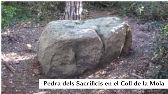
Pedra dels Sacrificis en el Coll de la Mola

ficis: les concavitats servien per dipositar les vísceres de la víctima i la sang fluïa pels canalons. Hi ha qui li ha trobat característiques màgiques. Mai millor dit, el que “no sabem encara on acaba la història i on comença la llegenda”.