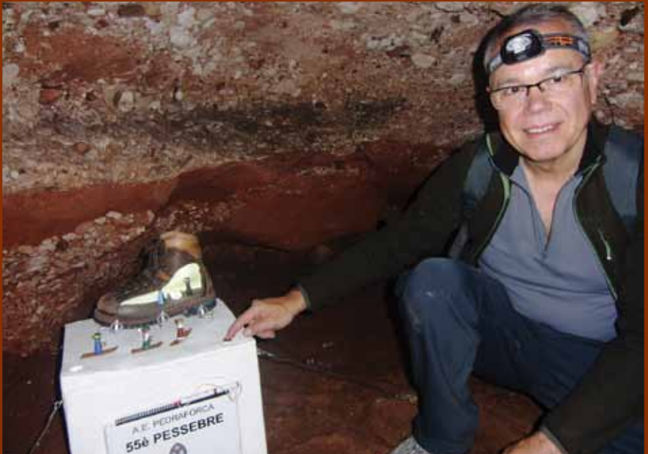
55è Pessebre A.E.Pedraforca instal·lat a la Cova Simanya