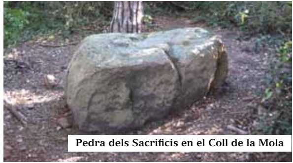
Pedra dels Sacrificis en el Coll de la Mola

ficis: les concavitats servien per dipositar les vísceres de la víctima i la sang fluïa pels canalons. Hi ha qui li ha trobat característiques màgiques. Mai millor dit, el que “no sabem encara on acaba la història i on comença la llegenda”.