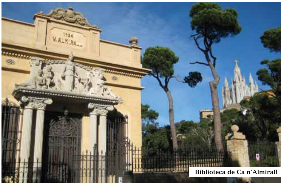
Biblioteca de Ca n'Almirall

BIBLIOTECA de CA n'ALMIRALL. Aixecada l'any 1924 per la viuda del polític i escriptor catalanista Valentí Almirall (1841-1904); contigua a la casa d'estiueig, per albergar-hi la seva biblioteca personal. A l'exterior hi destaca un grup escultòric amb al·legories del coneixement i a l'interior diversos símbols maçònics en la decoració.