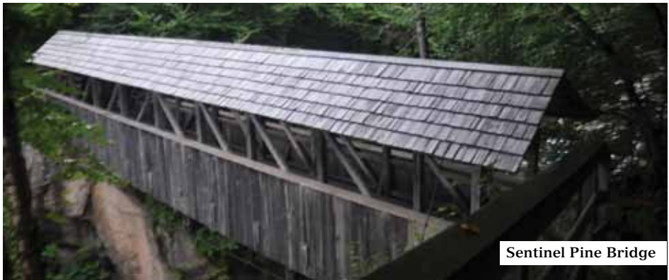
Sentinel Pine Bridge

Aprofitem una petita minva de la pluja i seguim amunt, ara per escales força dretes arran de paret de roca fins a arribar a un aixopluc que per cert està atapeït de gent i no ens hi podem encabir. Molta gent no ha estat tan previsor a com nosaltres i estan xops de cap a peus. No duïen protecció per la pluja. Com que no podem descansar a recer de la pluja seguim endavant pel Ridge Path , un ample camí totalment cobert per una espessa capa formada per branques de centenaris roures, faigs i aurons, els de la fulla de l'escut del Canadà. Poc abans de la Liberty Gorge torna la pluja amb més força encara i també els trons. Per salvar un impetuós torrent passem per un pont cobert, el Sentinel Pine bridge del 1939, un dels molts que hi ha en aquesta zona. Són ponts amb una coberta de doble vessant amb forta inclinació cap al corrent de l'aigua per facilitar el lliscament de la neu cap al riu i evitar que la forta acumulació de neu pugui ensorrar el pont. La darrera part de l'itinerari ens mostra unes immenses roques anomenades rocs erràtics glacials. Van ser arrossegats per la gelera fa 25.000 anys i quan aquesta va desaparèixer van quedar situats aquí. Algunes roques pesen més de 300 tones. Finalment pel Wildwood Path arribem al final del camí.