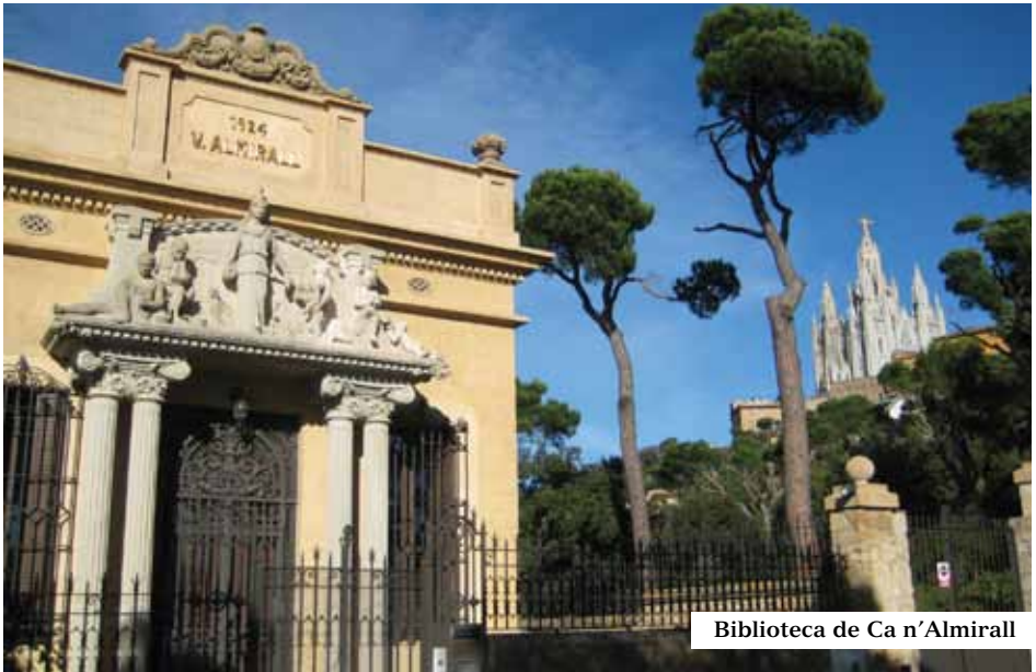
Biblioteca de Ca n'Almirall

BIBLIOTECA de CA n'ALMIRALL. Aixecada l'any 1924 per la viuda del polític i escriptor catalanista Valentí Almirall (1841-1904); contigua a la casa d'estiueig, per albergar-hi la seva biblioteca personal. A l'exterior hi destaca un grup escultòric amb al·legories del coneixement i a l'interior diversos símbols maçònics en la decoració.