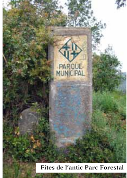
Fites de l'antic Parc Forestal

FONT del BACALLÀ. Font històrica, recuperada el 1986 per un grup de voluntaris. Reconeguda aigua com afavoridora de la digestió. És una construcció semicircular de mamposteria ben travada; al mig, un cos alt amb relleu esculpit, al·legòric del nom i a sota, una canella amb bon doll d'aigua, que desguassa en un clot petit. A cada lateral hi ha adossats uns funcionals seients amb un paviment central de lloses. Tot bastit amb pedra del lloc.