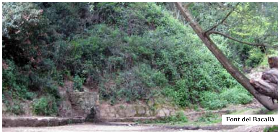
Font del Bacallà

El CAMÍ ROMÀ de SANT CUGAT. A l'any 1877 s'inaugurà La Rabassada, una carretera de sinuós traçat i tancats revolts que connecta Barcelona i Sant Cugat del Vallès a través del Coll de l'Erola per tota la serralada. Fins aleshores i des del segle IV d.C. quan, segons diu la llegenda, tropes romanes fundaren el campament de Castrum Octavianum (Castell d'Octavià), al lloc on avui es troba el Monestir de Sant Cugat, en la "variant" interior de la Via Augusta, que era creuada per un camí secundari que travessava Collserola per la Torre Negra, Sant Adjutori, Sant Medir, Vista Rica, Sant Jeroni de la Vall d'Hebron, Sant Genís dels Agudells, Josepets i acabava en el Portal de l'Àngel als peus de la muralla.