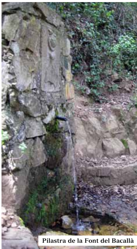
Pilastra de la Font del Bacallà

1 h 12' Carretera de la Rabassada , reprenem el corriol de baixada que alternativament, fa costat al corrent. Poc abans d'arribar a la carretera, localitzem a l'esquerra un blanquinós edifici abandonat.