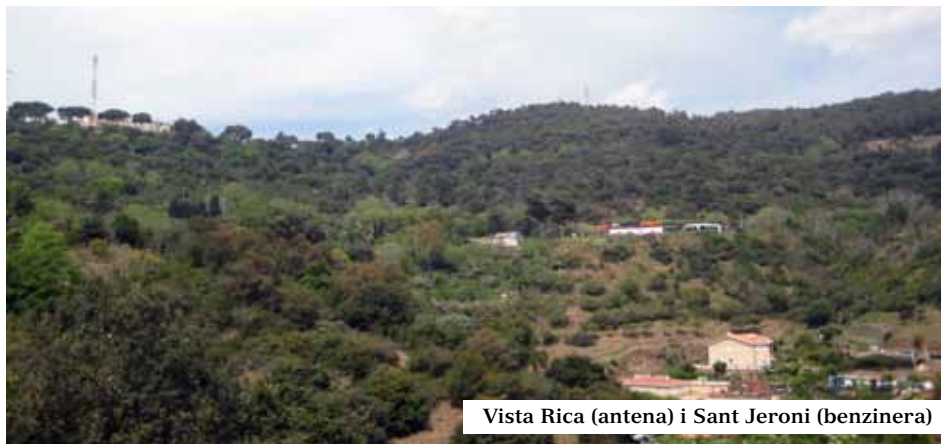
Vista Rica (antena) i Sant Jeroni (benzinera)

EL CAMÍ ROMÀ de SANT CUGAT. A l'any 1877 s'inaugurà La Rabassada, una carretera de sinuós traçat i tancats revolts que connecta Barcelona i Sant Cugat del Vallès a través del Coll de l'Erola per tota la serralada. Fins aleshores i des del segle IV d.C. quan, segons diu la llegenda, tropes romanes fundaren el campament de Castrum Octavianum (Castell d'Octavià), al lloc on avui es troba el Monestir de Sant Cugat, en la "variant" interior de la Via Augusta, que era creuada per un camí secundari que travessava Collserola per la Torre Negra, Sant Adjutori, Sant Medir, Vista Rica, Sant Jeroni de la Vall d'Hebron, Sant Genís dels Agudells, Josepets i acabava en el Portal de l'Àngel als peus de la muralla.