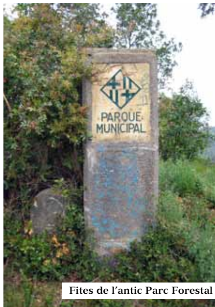
Fites de l'antic Parc Forestal

FONT del BACALLÀ. Font històrica, recuperada el 1986 per un grup de voluntaris. Reconeguda aigua com afavoridora de la digestió. És una construcció semicircular de mamposteria ben travada; al mig, un cos alt amb relleu esculpit, al·legòric del nom i a sota, una canella amb bon doll d'aigua, que desguassa en un clot petit. A cada lateral hi ha adossats uns funcionals seients amb un paviment central de lloses. Tot bastit amb pedra del lloc.