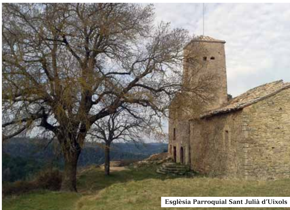
Església Parroquial Sant Julià d'Uixols

Des d'aquest punt podem gaudir d'una bonica panoràmica, tant del Montseny com dels penya-segats del Moianès. A la dreta de les ruïnes i seguint encara les marques liles continuem pel sender que a poc a poc s'eixampla. Encreuament. Intersecció de tres camins. Agafem el que marxa a l'esquerra (marques liles). 300 m més endavant ens trobem davant un petit pujol de terra grisa, a la dreta del qual surt un camí que seguim deixant la pista principal. Pocs metres més enllà sortim a una pista més ampla, que seguim a l'esquerra, i des d'allà ja veiem la casa de la Noguera.