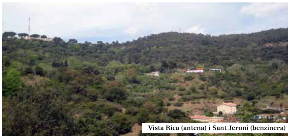
Vista Rica (antena) i Sant Jeroni (benzinera)

El CAMÍ ROMÀ de SANT CUGAT. A l'any 1877 s'inaugurà La Rabassada, una carretera de sinuós traçat i tancats revolts que connecta Barcelona i Sant Cugat del Vallès a través del Coll de l'Erola per tota la serralada. Fins aleshores i des del segle IV d.C. quan, segons diu la llegenda, tropes romanes fundaren el campament de Castrum Octavianum (Castell d'Octavià), al lloc on avui es troba el Monestir de Sant Cugat, en la "variant" interior de la Via Augusta, que era creuada per un camí secundari que travessava Collserola per la Torre Negra, Sant Adjutori, Sant Medir, Vista Rica, Sant Jeroni de la Vall d'Hebron, Sant Genís dels Agudells, Josepets i acabava en el Portal de l'Àngel als peus de la muralla.