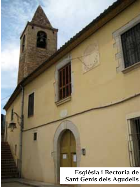
Església i Rectoria de Sant Genís dels Agudells

SANT GENÍS dels AGUDELLS. Antiga parròquia amb fogars, predecessora de la vila d'Horta; fou consagrada molt probablement a l'any 931, va