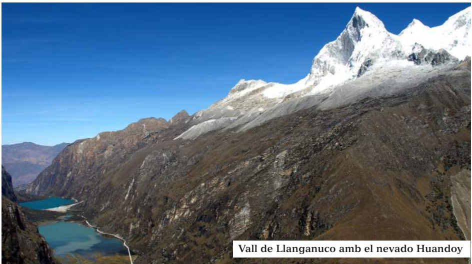
Vall de Llanganuco amb el nevado Huandoy

L'endemà al matí ens endinsàrem per la Quebrada del Llanganuco fins a arribar a les turqueses aigües de la Laguna de Chinancocha (3.850m.),