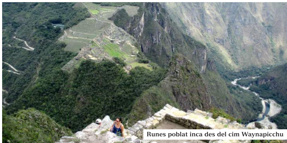
Runes poblat inca des del cim Waynapicchu

contenta és perquè no vol! La veritat és que és impressionant veure com van apareixent les terrasses, les parets de les runes, les poques edificacions, les roques i, finalment... l'espectacular roca del Waynapicchu! Tot d'entremig de la boira a 2.453m d'altitud, si fa no fa com el nostre estimat Pedraforca!