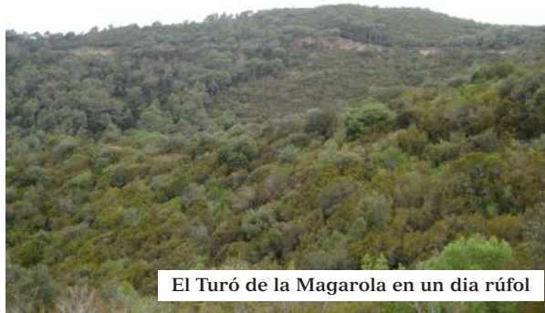
El Turó de la Magarola en un dia rúfol

1 h 21' Clariana , quan s'acaba el viarany, rètol vers Tibidabo – Pas del Rei. Tirem avall per aquest camí.