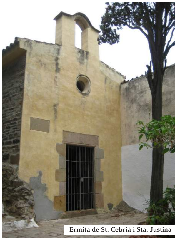
Ermita de St. Cebrià i Sta. Justina

L'any 1786 restava força malmesa i fou reformada durant la primera meitat del segle XIX, quan passà a mans privades arran de vendre's per la Desamortització. Del seu interior s'han conservat part de la pintura i el bonic retaule barroc, del qual foren cremades totes les imatges en temps de l'eufòria revolucionària de 1936.