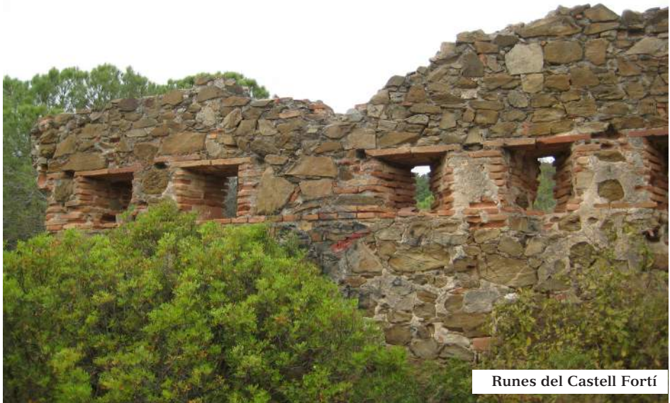
Runes del Castell Fortí

CASTELL del FORTÍ. És una edificació militar fortificada, construïda sobre un tossal amb mamposteria i maó, sota el Turó del Trac. És força misteriosa, només en queden dempeus unes ruïnes al mig i alguns llenços de façana amb una filera d'espitlleres. De planta rectangular amb dues defenses semicirculars i una petita entrada lateral.