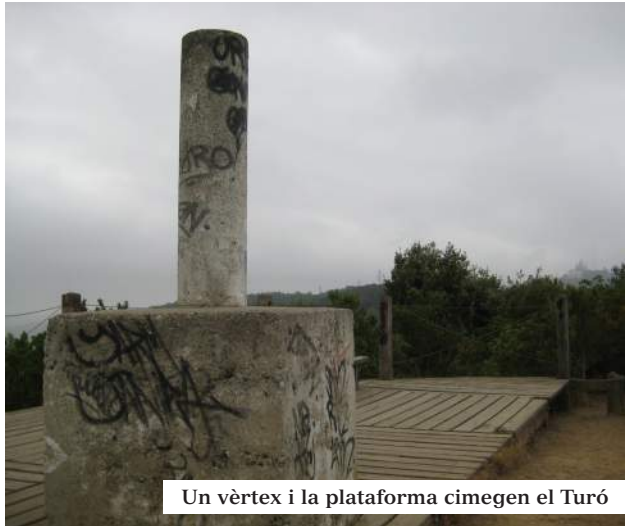
Un vèrtex i la plataforma cimegen el Turó

Durant la darrera campanya, tardor de 2014, les espècies més freqüents i nombroses han estat l'aligot vesper, l'arpella, l'esparver vulgar, el xoriguer, el falcó mostat-