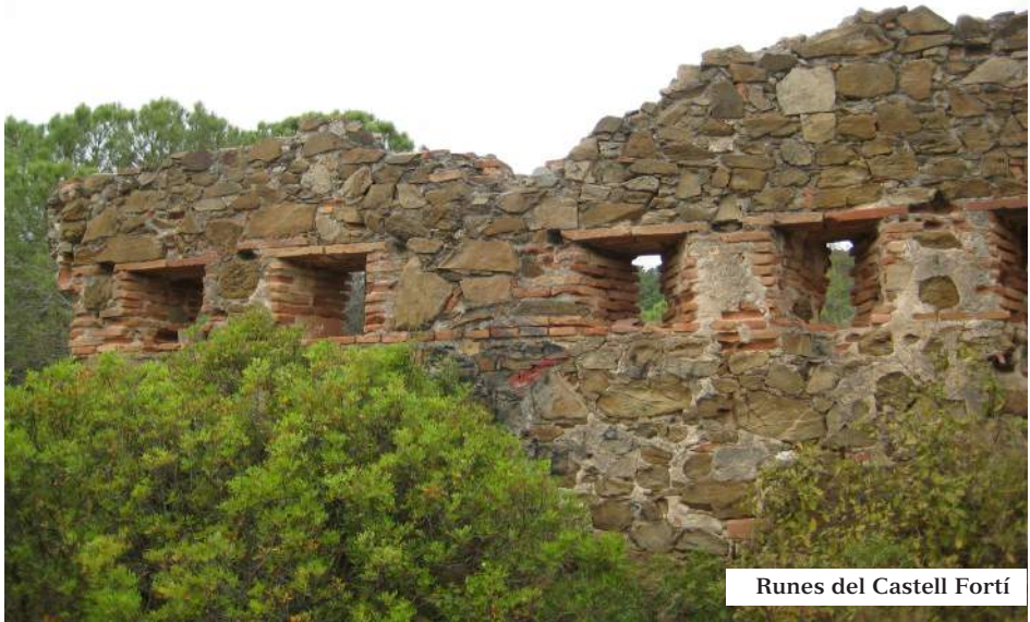
Runes del Castell Fortí

CASTELL del FORTÍ. És una edificació militar fortificada, construïda sobre un tossal amb mamposteria i maó, sota el Turó del Trac. És força misteriosa, només en queden dempeus unes ruïnes al mig i alguns llenços de façana amb una filera d'espitlleres. De planta rectangular amb dues defenses semicirculars i una petita entrada lateral.