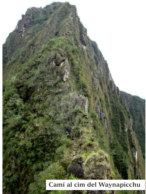
Camí al cim del Waynapicchu

Deu ser fantàstic arribar a dalt amb el sol acabat d'aparèixer per l'horitzó format per les muntanyes que envolten l'emplaçament inca. Però nosaltres ho visquérem veient sorgir aquelles pedres d'entre la boira... Tenia un caire de misteri que ens permeté anar-ho descobrint progressivament. Va tenir el seu encant, i qui no es