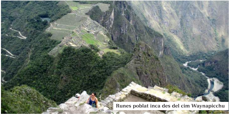
Runes poblada inca des del cim Waynapicchu

contenta és perquè no vol! La veritat és que és impressionant veure com van apareixent les terrasses, les parets de les runes, les poques edificacions, les roques i, finalment... l'espectacular roca del Waynapicchu! Tot d'entremig de la boira a 2.453m d'altitud, si fa no fa com el nostre estimat Pedraforca!