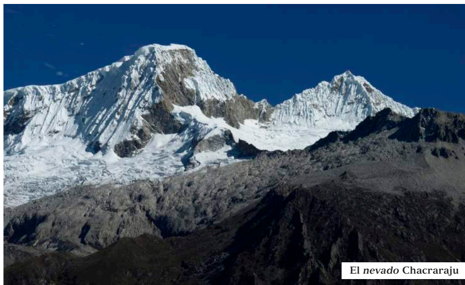
El nevado Chacaraju

tenint a la dreta el Huascarán i a l'esquerra el Huandoy de 6.395m. Seguïrem amunt per una pista que va cap a Chavin de Huántar, passant per Yanama. Deixàrem a la dreta la Laguna de Orcancocha, d'aigües més pàl·lides que l'anterior. A mesura que ens anàvem enfilant la vall s'obria oferint-nos un espectacle esplèndid dels Nevados que la voregen: a més dels ja citats, el Yanapacha, el Pisco (5.752m.), el Chacaraju (6.112m.) i el Chopicalqui (6.354m.), al costat del Huascaran. Arribàrem fins al mirador del Portachuelo de Llanganuco, a 4.880m. Va ser emocionant poder contemplar tota aquella grandiositat en un dia tan magnífic!