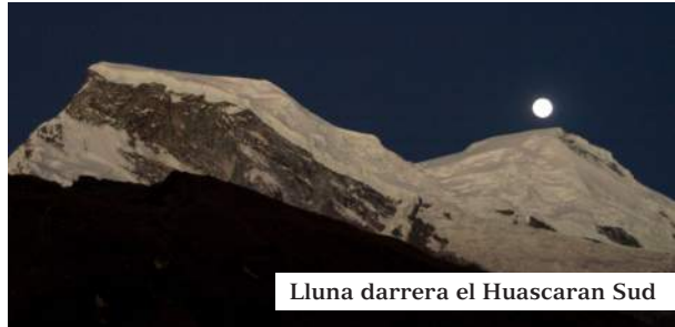
Lluna darrera el Huascarán Sud

uns 30.000 morts. La natura, per sort de tant en tant, es fa sentir i no sempre agradablement. Per això els antics, per aplacar la Pachamama , li oferien sacrificis i presents, abans que no s'ho agafés ella mateixa. Visitàrem la zona on ha-