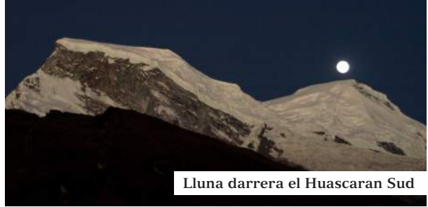
Lluna darrera el Huascarán Sud

uns 30.000 morts. La natura, per sort de tant en tant, es fa sentir i no sempre agradablement. Per això els antics, per aplacar la Pachamama , li oferien sacrificis i presents, abans que no s'ho agafés ella mateixa. Visitàrem la zona on ha-