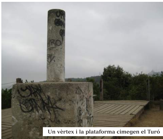
Un vèrtex i la plataforma cimegen el Turó

Probablement romànica del segle XII, construïda amb senzills carreus de llicorella i dedicada a dos sants coetanis, nascuts en el segle III. A la fa-