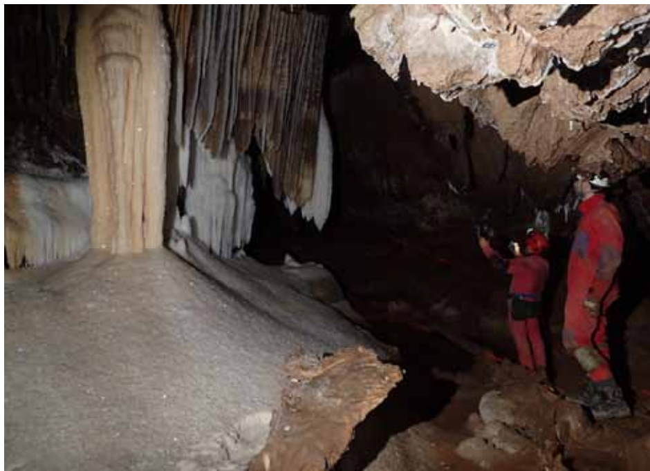
Sala de la Momia

Conflent Espeleo Club de Prada, aviat va ser protegida també per les lleis franceses i des del 1983 l'accés està tancat, reservat pels estudiosos i exploradors, els trams amb més formacions es troben abalisats per cintes de color que senyalen l'itinerari que han de seguir els espeleòlegs sense sortir-se'n i sense acostar-se a les parets ni trepitjar a fora, ha estat inscrita dins del patrimoni mundial de la UNESCO, prohibint-se l'entrada a les sales blanques per preservar els delicats recobriments blancs de les parets.