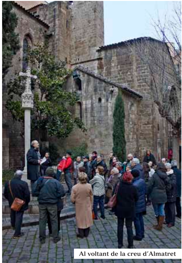
Al voltant de la creu d'Almatret