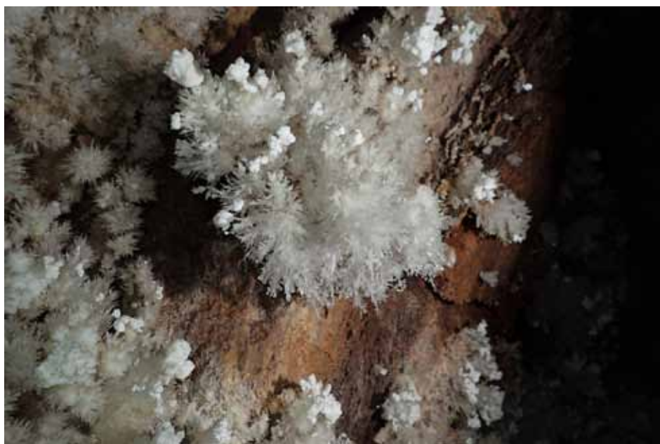
Detall d'aragonit amb hidromagnesita