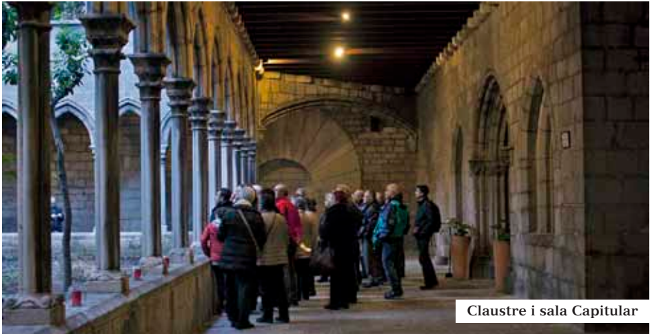
Claustre i sala Capitular

nament romànic, aprofitant una esglésiola del 1050. Recognoscible en el presbiteri on hi destaquen les finestres (algunes tapiades), l'absis rectangular d'influència cistercenca (apropiada per les ordes militars) i en el cimbori, amb elements de transició al gòtic com les quatre mènsules adornades a l'arrencada de les nervadures de la volta i la porta de la sala Capitular de fines arquivoltes i treballats capitells. De finals del segle XIII és la sòbria capella de la Puríssima, situada a l'esquerra de l'entrada.