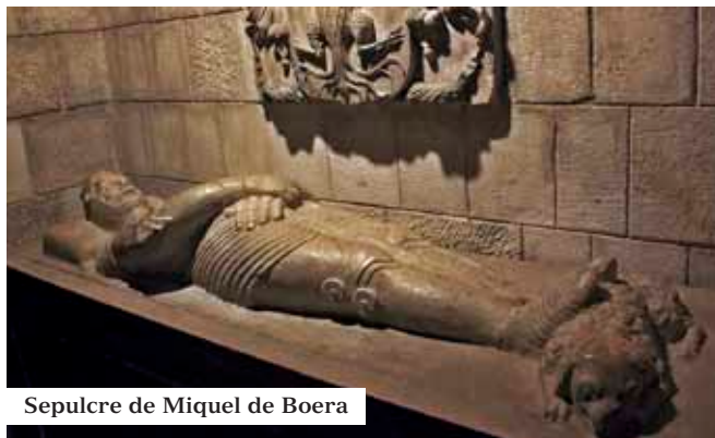
Sepulchre de Miquel de Boera

Fou l'origen del burg, després vil·la de Santa Anna, delimitat al segle XIII per la primera muralla medieval d'en Pere el Gran. El recinte s'estenia des de les torres de Canaletes a la Rambla, passant pel carrer, porta i plaça de Santa Anna fins al portal de l'Àngel o dels Orbs, on en pocs anys les aristocràcies locals el van convertir en un dels seus llocs preferits per a viure-hi.