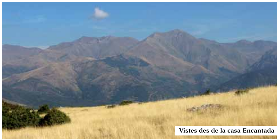
Vistes des de la casa Encantada

Entre matolls i herba alta cal fer atenció en anar trobant les marques grogues, per arribar, després de travessar un magnífic bosquet, a la casa Encantada, que és un Dolmen molt ben conservat a dalt d’un turonet.