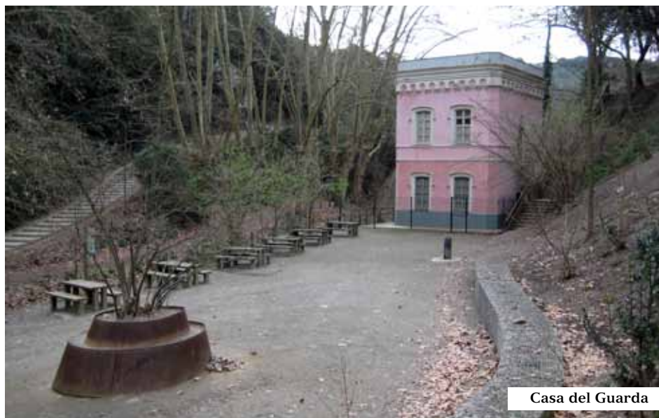
Casa del Guarda

El paleta Vicenç Sabater va construir en mina la canalització d'aigües que nomenaren Grot. L'acabà el 1856 amb tan sols un parell de minaires ajudats d'eines de mà i dues mules. Executaren una foradada recta de 1.290 m de llarg i 2 m d'alt que comença barranc avall a 150 m del mur. Travessa la serra a 75 m sota el coll de Vallvidrera i la boca de l'altre costat es troba carretera amunt del Peu del Funicular al costat del Col·legi Montserrat. Per arribar-hi cal ascendir per un tram del GR 96; una escala ben senyalitzada que surt de l'escola i mena cap a Vallvidrera, on a uns 200 m a la dreta veurem la tanca de maons i el reixat de ferro originals que resguarden la bocana.