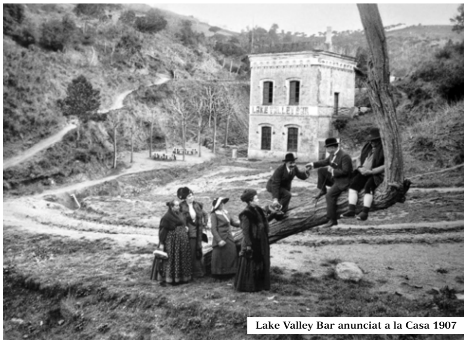
Lake Valley Bar anunciat a la Casa 1907

El pantà de Vallvidrera és el més gran dels tres existents a Collserola i un valuós patrimoni natural i arquitectònic, sortosament recuperat pel Consorci del Parc l'any 2008 després de l'abandó i caure en oblit de 40 anys. És una joia d'embassament del segle XIX, un exemple de presa d'arc de gravetat formada per un dic d'obra vista amb una galeria perimetral resseguint la base i accessible des de l'edifici de vigilància amb una capacitat de 10.000 m 3 ; té 50 m. de longitud, 3 m d'amplada i 16 m d'alçària.