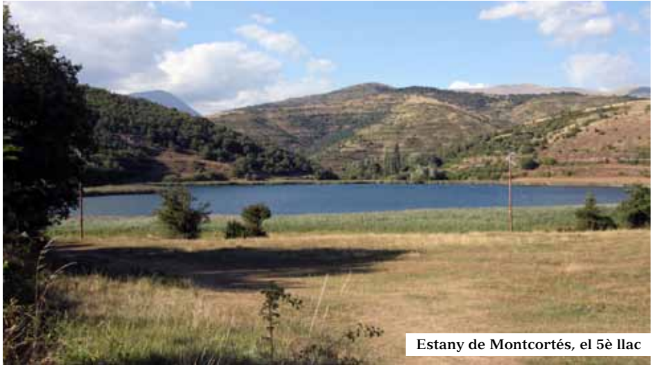
Estany de Montcortès, el 5è llac

En realitat és el 5è llac, situat en un altiplà a uns 1000 m d'altitud. La ruta bàsica ens portaria des de Senterada fins a la Pobla de Segur de 23 km, passant pel Llac i novament per la Geganta.