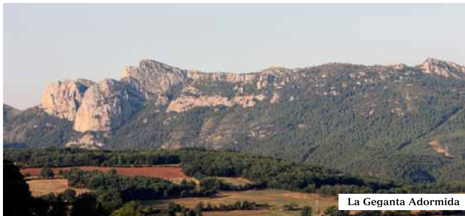
La Geganta Adormida

Un dels principals valors de la ruta és que la major part del recorregut es fa per camins de ferradura i corriols de muntanya (62%), alguns recuperats per a l'ocasió i d'altres ja marcats pels respectius consells comarcals. Si bé en cada etapa trobarem trams per pista (26%) i carretera (12%). Fent camí anirem aprenent que la zona ha estat habitada des de la prehistòria fins a l'actualitat. Trobarem dòlmens, ermites, esglésies, viles closes, monestirs, ponts i restes romàniques, bordes, masies i cabanes de pastor. Aquests últims són exemples d'arquitectura en pedra seca, un ric tresor de la nostra història, com també ho són els camins transcorreguts, camins de pastors.