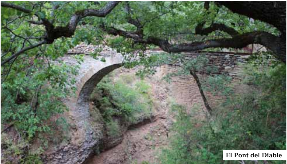
El Pont del Diable

Continuem el trajecte cap Antist i després cap a Estavill, com hem dit planejant, molt agradable. Ara el terreny es fa més abrupte, es fa evident que anem cap al pont del Diable, abans però passem per una gran barrancada per arribar a les runes del monestir de Sant Genis de Bellera, que suposem devia ser important en el seu temps per la grandària i pel fet de l'existència del pont del Diable, sobre una barrancada esfereïdora. Sua-