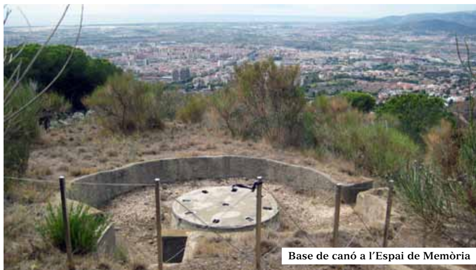
Base de canó a l'Espai de Memòria

Va ser un escenari tàctic durant l'últim esdeveniment bèl·lic, quan en el 1937 s'hi bastí un punt de defensa antiaeri i una estació de ràdio telefonia en el vessant de ponent. A més, en la modernista Caseta de les Aigües, en el camí del mateix nom sota de la bateria, es reconvertí en caserna per als soldats destinats allà. Era juntament amb Montjuïc, una de les dues posicions de suport a l'organització principal de contraatac, comandada des del Turó de la Rovira. El conjunt és avui un Espai de Memòria visible amb mirador i zona de lleure, on contemplarem les tres bases de formigó per a artilleria i vestigis dels reflectors i de la casamata. Funcionà més com a element de dissuasió que no pas d'atac en disposar només de metralladores d'escassa efectivitat, en quan l'objectiu inicial era abatre l'aviació enemiga mitjançant canons.