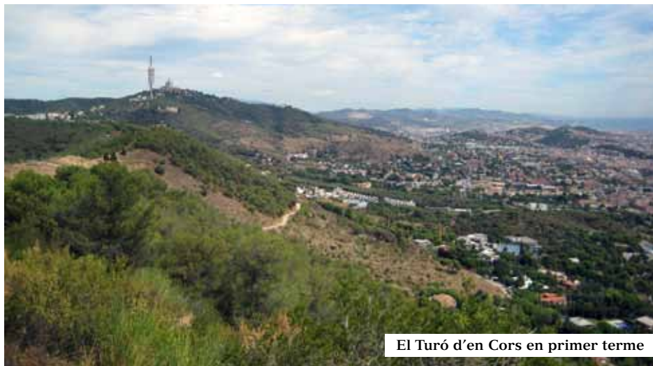
El Turó d'en Cors en primer terme

L'antena de comunicacions encimbella l'anàrquica edificació que es va bastir damunt la fonamentació d'una part del fortí i de l'edifici del telègraf òptic instal·lat el 1838 i que va funcionar ininterrompudament en el període de 1843 a 1863. Primer, damunt de l'antic campanar servia com línia militar i més tard, una altra d'ús civil amb el mecanisme instal·lat dalt d'una nova torre encastada i fortificada. Era un emplaçament d'unió de la costa, entre el nord (Montjuïc i Montgat) i el sud (Corbera i Ordal) i de connexió amb l'interior (Martorell i Can Maçana) a l'oest. Una xarxa per controlar els esdeveniments, els comunicats dels quals eren transmesos amb força rapidesa a tot Catalunya i València. En el subsòl hi havia indicis d'un petit poblat laietà.