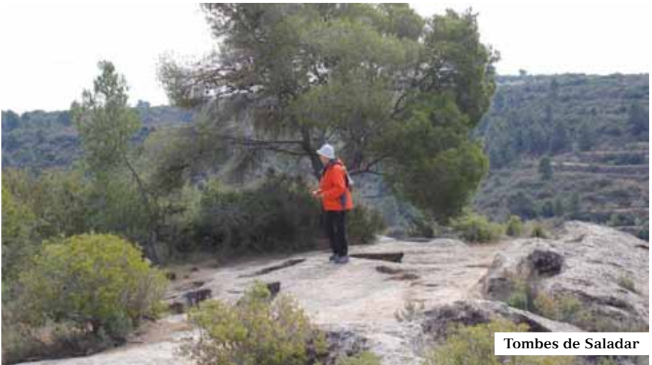
Tombes de Saladar

Els més importants són, juntament amb els del Cogul, els abrics situats a la serra del Godall i els trobats a Ulldecona (al Montsià) i els d'Oros de Balaguer, així com els ubicats a les muntanyes de Prades, al terme de Montblanc (al Baix Camp).