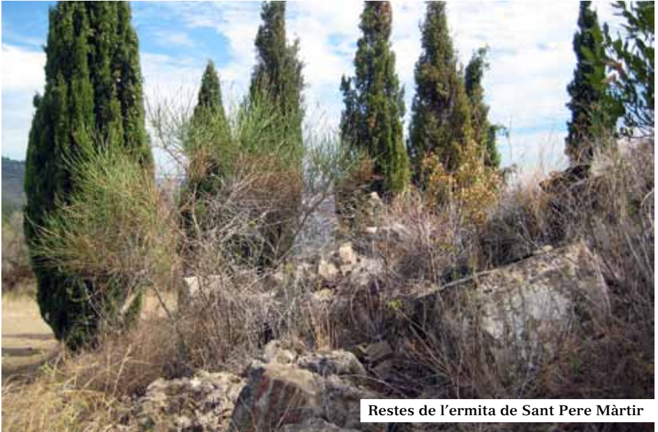
Restes de l'ermita de Sant Pere Màrtir

Aquesta talaia era coneguda fins al segle XVII com Puig d'Óssa i és aleshores, a partir de la construcció de l'ermita dalt del cim, quan comença la denominació de Sant Pere Màrtir per l'advocació del temple al sant italià, un fet que va bandejar-ne el topònim primigeni. L'església fou alçada en el pic, dins la possessió dels frares dominicans de Santa Caterina sobre el monestir de Santa Maria de Pedralbes a Sarrià de l'orde clarissa, branca femenina dels dominics. Era de mida notable, un conjunt format per una gran nau amb campanar adossat de secció quadrada i la rectoria en un cantó, que segons les fonts documentals aparentava una arquitectura intranscendent.