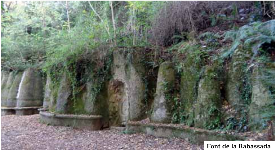
Font de la Rabassada

mençà la davallada: el restaurant – hotel es clausura l'any 1930, durant el 1933 cessen les atraccions i les activitats inherents. Quan la guerra civil va ser destinat a caserna de carrabiners, essent finalment enderrocats el 1943.