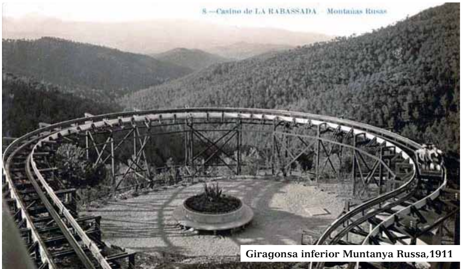
Giragonsa inferior Muntanya Russa, 1911

Pel que fa a les atraccions, les més modernes del mercat, les predilectes eren l'enorme Scenic Railway una muntanya russa de 1290 m de recorregut, desnivells de fins 25 m i part del trajecte soterrat mitjançant tres túnels, el més llarg de 57 m i la refrescant Water Chute unes barquetes que lliscaven per un tobogan de 65 m amb el 20% de pendent fins a arribar a un estany de 1540 m 2 . Entremig, en pavellons o envelats aïllats hom disposava de l' Abbey Bowling un joc de bitlles en camp de gespa, el Cake Walk una mena de joc de les cadires que es feia ballant en rollana i que en aturar-se al toc de xiulet, el premi era el pastís o laminadura que es tenia davant, la Maison Hantée o casa encantada, Palais du Rire els típics miralls convexos i còncaus que distorsionaven les imatges. A la nit, Feu de Boules la il·luminació general del recinte amb llums de Bengala i Focs Japonesos o d'artifici al tancament.