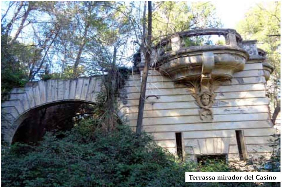
Terrassa mirador del Casino

La història comença a finals del segle XIX amb els pavellons del Mirador i Restaurant de la Reina, les Torres de les Aigües i de la Societat Columbòfila i l'ermita del Sagrat Cor al cim del Tibidabo, a on es construeix un ramal de carretera que permetia accedir-hi còmodament. Entre el 1901 i 1906 s'inauguren les primeres atraccions i el funicular. S'aixequen l'Observatori Fabra i el Museu de Física Mentora Alsina, a més del tramvia i funicular de Vallvidrera. Aquestes circumstàncies junt amb l'entusiasme en que es vivia i que el joc era tolerat, van motivar la voluntat d'invertir-hi. Va ajudar el que des de 1877 Barcelona restava unida amb Sant Cugat per la carretera de Gràcia a Manresa, que passava pel veïnat de l'Arrabassada i d'aquest sorgeix l'altre nom utilitzat per denominar la carretera.