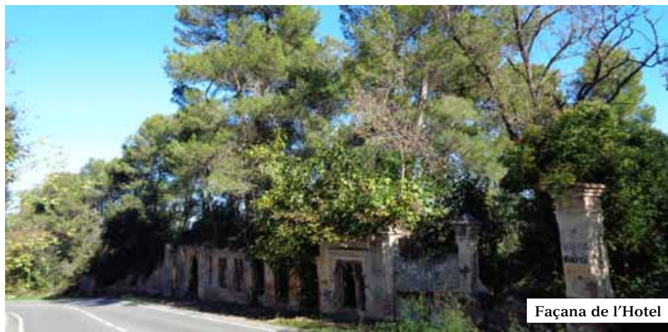
Façana de l'Hotel

Els paisatges vegetals tenen la seva pròpia memòria i la d'aquest bosc natural mediterrani, també. De l'alzinar original perennifoli, dominat per l'alzina amb sotabosc de dos estrats arbustius, un parell de sediments herbacis i abundants plantes enfiladisses, va passar a configurar el bosquerol actual on s'hi troben pins introduïts. Enmig i durant segles amb la propagació de l'agricultura, els boscos foren arrasats i convertits en terres de conreu, arribant així fins a les acaballes del s. XIX quan tota la part meridional de Collserola tornava a ser boscúries d'alzines amb pins, com molts segles abans.