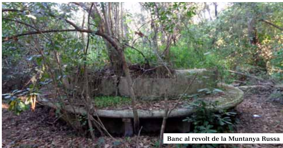
Banc al revolt de la Muntanya Russa

Per acostar-se en transport públic, l'usual era prendre el tramvia, estrenat alhora, que sortia del carrer Craywinckel i finalitzava a peu de Casino o bé amb cotxe de l'empresa, que es prenia a l'estació superior del funicular