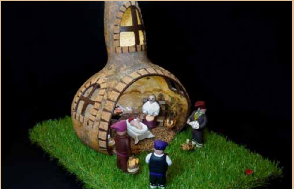
58è pessebre A.E.Pedraforca