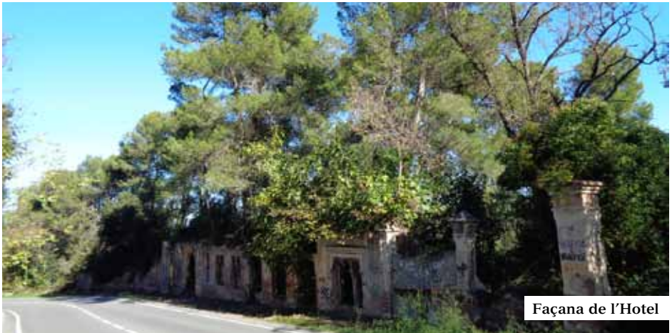
Façana de l'Hotel

Els paisatges vegetals tenen la seva pròpia memòria i la d'aquest bosc natural mediterrani, també. De l'alzinar original perennifoli, dominat per l'alzina amb sotabosc de dos estrats arbustius, un parell de sediments herbacis i abundants plantes enfiladisses, va passar a configurar el bosquerol actual on s'hi troben pins introduïts. Enmig i durant segles amb la propagació de l'agricultura, els boscos foren arrasats i convertits en terres de conreu, arribant així fins a les acaballes del s. XIX quan tota la part meridional de Collserola tornava a ser boscúries d'alzines amb pins, com molts segles abans.