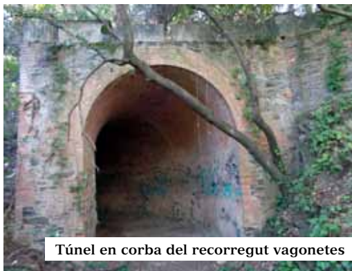
Túnel en corba del recorregut vagonetes

Els problemes polítics i la il·legalització del joc del 1912 portaren d'immediat la clausura de les sales d'apostes i joc, no la resta que acabà fent fallida el 1913. L'empresari va morir en el 1914, llavors co-