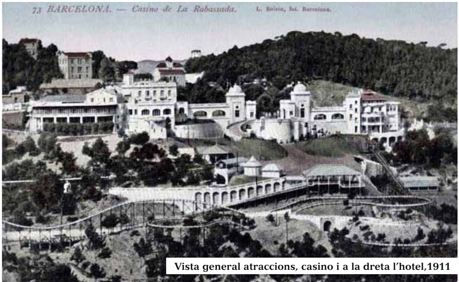
Vista general atraccions, casino i a la dreta l'hotel, 1911

Anant per la carretera de la Rabassada BP-1417 direcció Sant Cugat del Vallès, en el PQ 6,7 del vessant vallesà ja sobrepassat el camí de Sant Medir i en el Rabassalet, davant de l'avinguda de Can Cortès on hi ha el cartell indicador Can Rectoret –Les Planes, podem observar a tocar el voral uns llenços de paret. Són les ruïnes corresponents a l'accés del CASINO ATRACCIONS LA RABASSADA, un sumptuós i immens complex d'oci desaparegut fa 75 anys, que pren el nom de la serra on s'ubica. Un gran hotel, restaurant, instal·lacions de joc i diverses atraccions d'arquitectura modernista bonica i minuciosa.