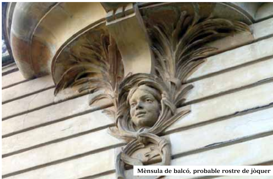
Mènscula de balcó, probable rostre de jòquer

Lechevallier. Adreçat als amants de l'esbarjo, de la muntanya i de les aigües sulfuroses de la Font de la Rabassada integrada en el conjunt. Disposava de 14 espaioses habitacions, oratori i un còmode restaurant obert al públic. Una orquestrina amenitzava els àpats en diumenges i festius i un servei directe de carruatges acostava la clientela des de Josepets.