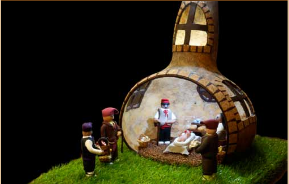
Foto portada: Cova Canaletes, Galeria del Monolit